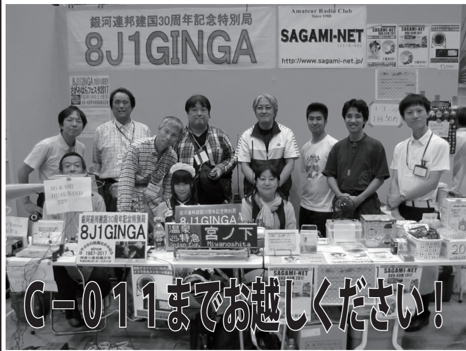
無線から今時のカルチャーまで、幅広いジャンルをカバーする不思議な空間。2017年は、銀河連邦建国30周年記念の特別局8J1GINGA/1も運用しました。